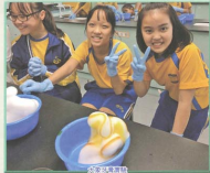
學生在實驗室工作