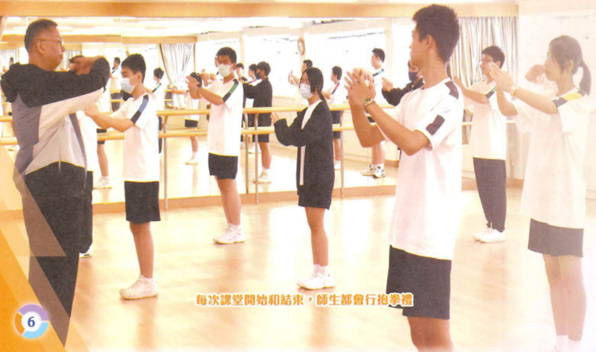
每次課堂開始和結束，師生都會行抱拳禮

有幸地校長在體育課以身教方式向同學授教詠春，校長教了「小念頭」這一套拳法。學習過程當中我明白詠春並非只是健身套拳，更可以用來自我防衛，以備不時之需。除了可以培養我對非物質文化遺產的認識，更可以培養品德，如：尊師重道。更能令我明白「堅持」的道理，想要好每一套拳，必須堅持。總括而言，學習詠春能令我增長知識、了解中國文化，更能修養自己的品德，我十分慶幸能夠學到詠春。