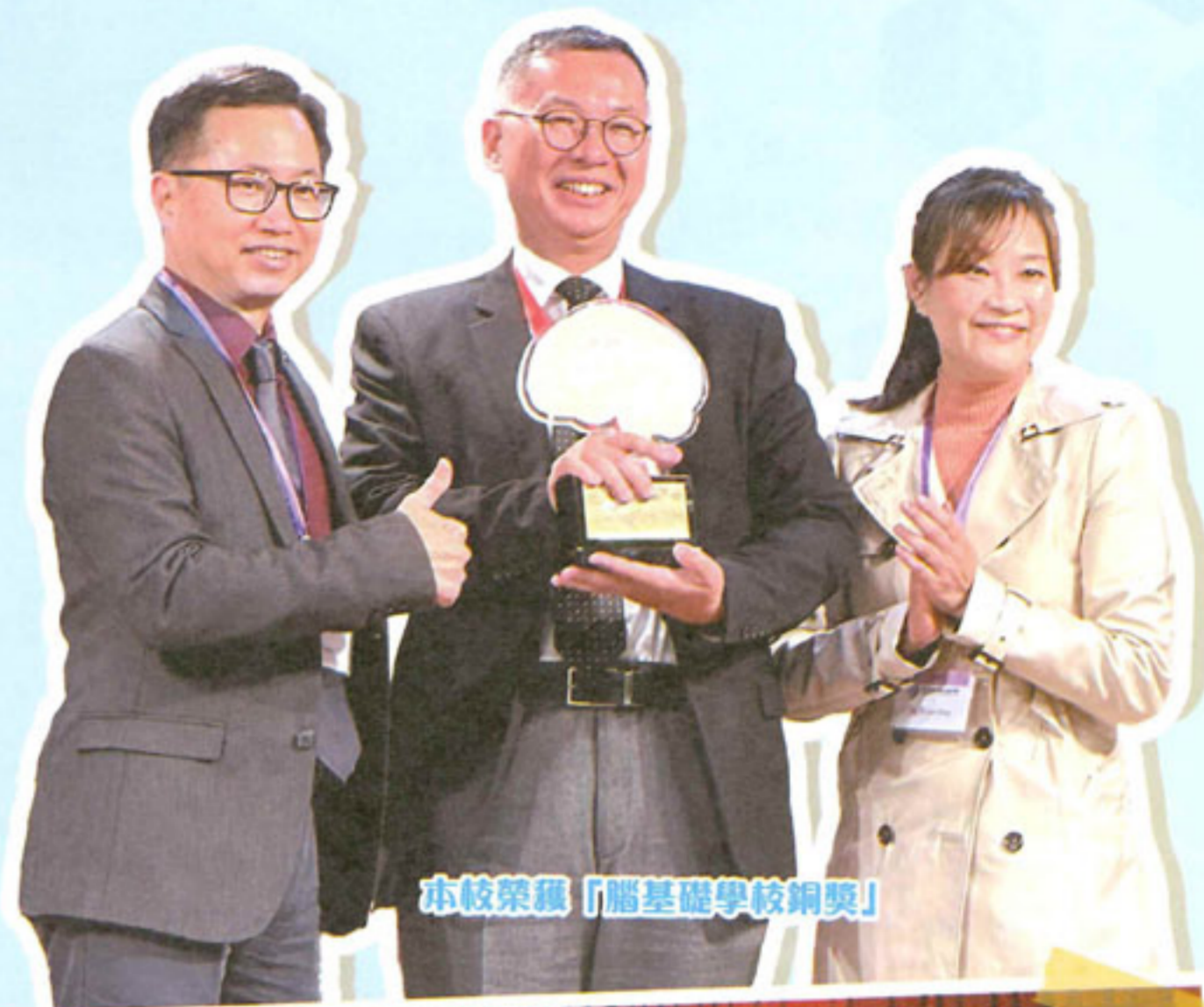
本校榮獲「腦基礎學校銅獎」

經過一連串的培训及觀課，本校成功於二零二三年十二月十六日正式榮獲認證為——腦基礎學校銅獎，成為全港少數獲得國際腦基礎教育認證的學校，並且是全港首間設立腦波中心的中學，甚感榮幸。