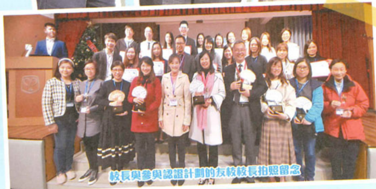
校長與參與認證計劃的友校校長拍照留念