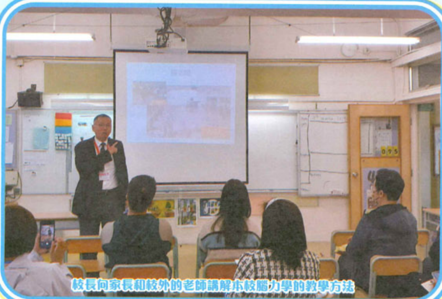
校長向家長和校外的老師講解本校腦力學的教學方法