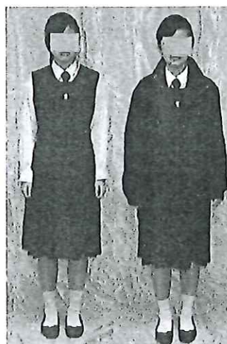
女生冬季校服式樣