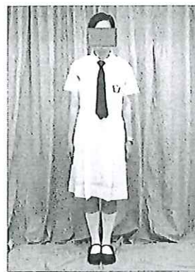
女生夏季校服式樣