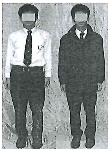
男生冬季校服式樣