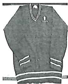
冬季毛衣校服式樣

學生需穿着由校方指定深藍色的羊毛冷衫(邊旁有粉藍色條子)、深藍淨色羊毛冷衫(需配鐵校徽)、黑色外套或深藍色的頸巾，以作為禦寒保暖。