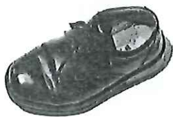
男學生及女學生鞋式樣