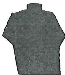
冬季外套校服式樣