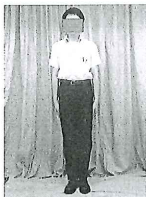
男生夏季校服式樣