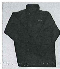
冬季外套校服式樣