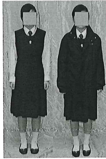
女生冬季校服式樣