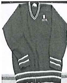
冬季毛衣校服式樣

學生需穿着由校方指定深藍色的羊毛冷衫(邊旁有粉藍色條子)、深藍淨色羊毛冷衫(需配鐵校徽)、黑色外套或深藍色的頸巾，以禦寒保暖。