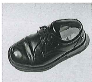
男學生及女學生鞋式樣